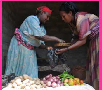
በሴቶችና ወጣቶች ላይ ያነጣጠረ ድጋፍ

የግብርና መልካም ተሞክሮዎችን በማስፋት ምርታማትን ይጨምራል ተወዳዳሪነትንም ያሻሽላል።