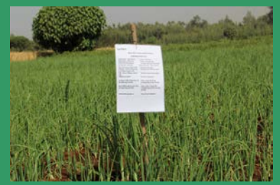
የግብርና መልካም ተሞክሮዎችን ማስፋት

ፕሮግራሙ የገበያ ትስስር መድረኮችን፣ የጉድኝት (ክላስተር) አደረጃጀቶችን እና በእሴት ሰንሰለቱ ተሳታፊ የሆኑ አካላት አዳዲስ እድሎችን በማግኘት የአቅርቦት ሰንሰለት ማንቆዎችን ለመፍታት የሚያስችሏቸውን ኩነቶች ይደግፋል።