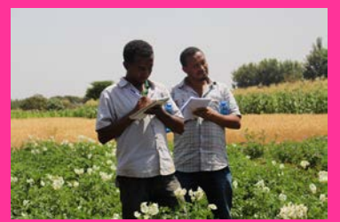
ፈጠራን ለማበረታታት የሚያስችሉ አሰራሮች

ለአምራች ህብረት ስራ ማህበራት ለግብይት የሚውል የመስሪያ ካፒታል ተዘዋዋሪ ብድር ያቀርባል። ይህንን ብድር የገንዘብ ቁጠባና ብድር ማህበራት ዩኒየኖች ያስተዳድራሉ።