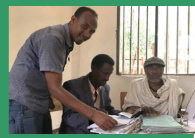
የህብረት ሥራ ማህበራት ለአባላት የሚሰጡትን አገልግሎቶች ማሻሻል

በየአካባቢው የሚገኙ የገንዘብ ቁጠባና ብድር ህብረት ስራ ማህበራት ደግሞ ለሴቶችና ወጣቶች የተመደበውን ተዘዋዋሪ የብድር ገንዘብ ያስተዳድራሉ።