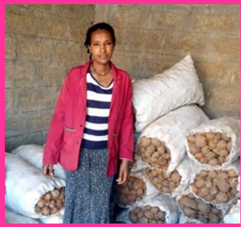
አምራቾችን ከገበያ ጋር ማስተሳሰር

አግሮቢግ አርሶአደሮችና የህብረት ሥራ ማህበራት ከምርት ገዥዎቻቸውና አቅራቢዎቻቸው ጋር ጠንካራ የገበያ ትስስር እንዲፈጥሩ ድጋፍ ያደርጋል።